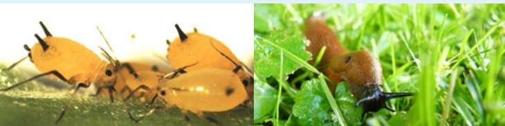
Nicht die beliebtesten Gäste in unseren Gärten: Blattläuse (links) und Nacktschnecken wissen, was gut schmeckt.

Schnecken wissen genau, was ihnen schmeckt. Sie bevorzugen aus einem reichhaltigen Nahrungsangebot im Garten Pflanzen, die einen hohen Wassergehalt aufweisen und zudem ungiftig sind. D.h., Salat ist ein wahrer Leckerbissen für Schnecken.